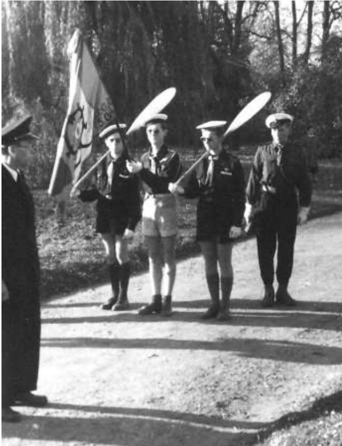
Brat'ka se skauty