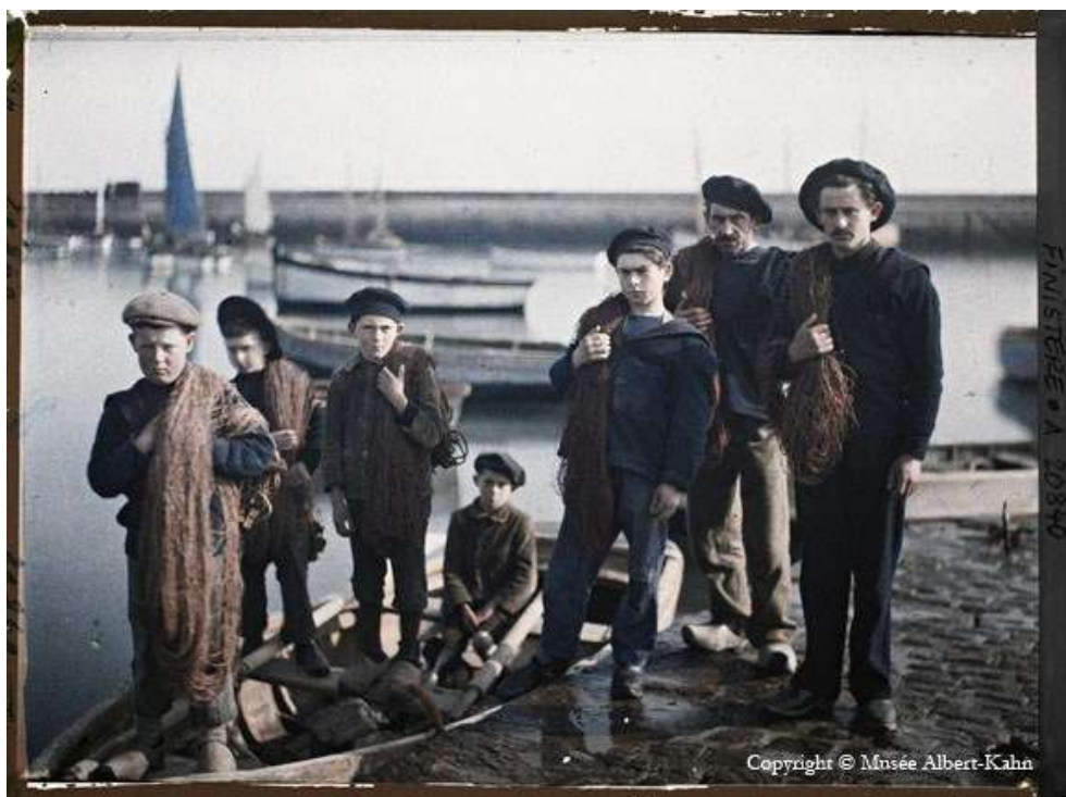
Takové to před 100 lety bylo: Rybáři ve Francii