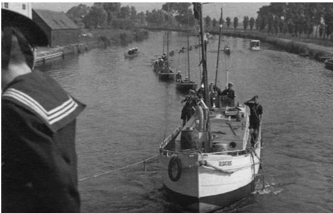
Plavba na Jamboree 1937

Další sada fotografií je z plavby na Jadranu v r. 1934