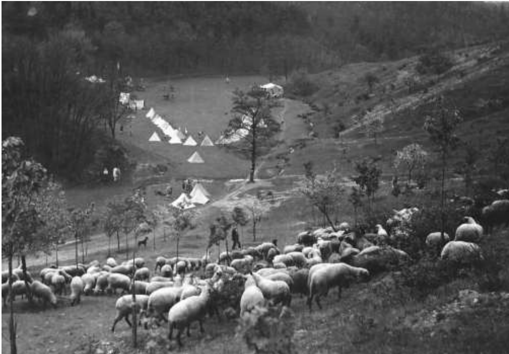
Kde? Asi v Nižboru.