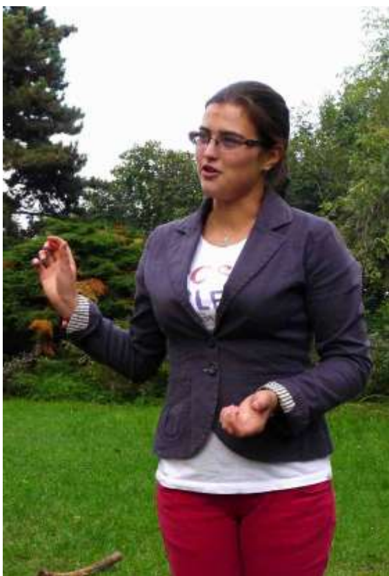
Peli při výkladu o Jamboree ve Švédsku