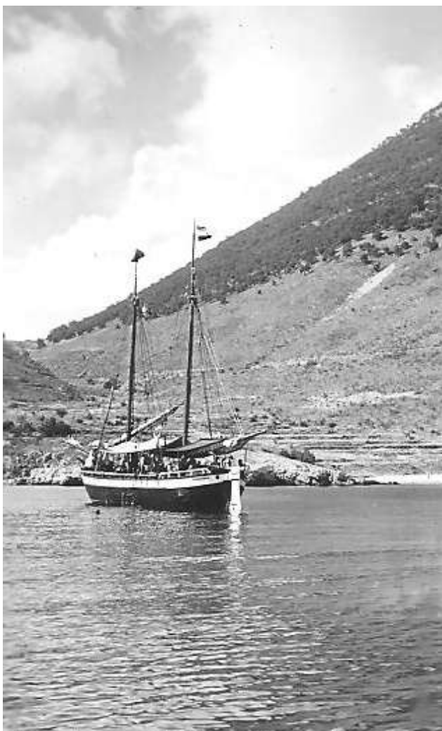
Gospa – Poišana

Další jsou fotografie, u kterých není jasné z jaké jsou doby a o jaký podnik se jednalo.