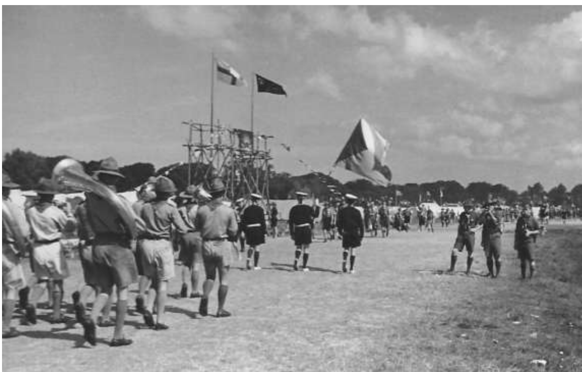
Češi na Jamboree v r. 1937