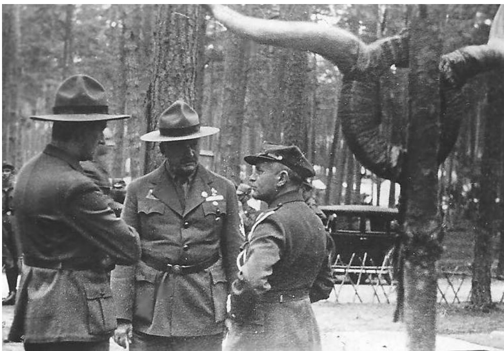
Spala 1934: Co to bylo? Kdo je na fotografii?